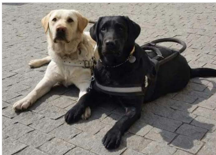
Glory Love ve výcviku (napravo)

Nadační příspěvek ve výši 30.000,- Kč směřoval konkrétně na úhradu nákladů na pořízení štěněte labradorského retrívra jménem Glory Love a na úhradu nákladů na předvýchovu tohoto štěněte (2. – 12 měsíc věku) v rodině dobrovolníků (zahrnuje krmení, očkování, komplexní veterinární prohlídku v 6 a 12 měsících věku, dopravu na pravidelná měsíční kondiční výcviková cvičení). Štěně bylo vybráno díky svým genetickým a povahovým vlastnostem jako budoucí vodící pes pro zrakově znevýhodněného občana. V období předvýchovy se naučí základním povelům a dovednostem adekvátně ke svému věku. Po úspěšném absolvování veterinární prohlídky v jednom roce věku bude další rok pokračovat ve specializovaném výcviku. Po složení zákonem předepsaných zkoušek projde adaptivním výcvikem u vybraného klienta a bude s ním pracovat jako vodící pes.