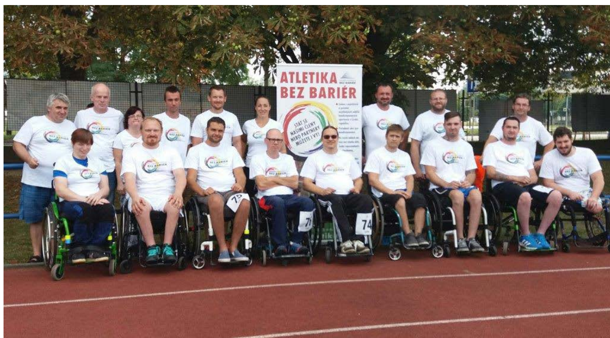
Atletika Bez Bariér Pardubice – členové spolku

Hendikepovaným soutěžícím přispěla Nadace LR na odměny a dary, dále také na podporu činnosti ve prospěch hendikepovaných, částkou 25.000,- Kč. Nadace LR chce spolku nadále zachovat přízeň a společným úsilím pomáhat vytvářet lepší podmínky pro sport (nejen hendikepovaných) v Pardubickém kraji.