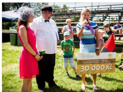
LETNÍ SPORTIÁDA aneb Skok přes Taxis – předání šeku na svozový autobus

Škola Svítání rozvíjí činnost prospívající dětem, mládeži a dospělým lidem s mentálním a kombinovaným postižením. Poskytuje vzdělávání a další služby směřující k rozvoji jejich osobnosti a zapojení do běžného života. V roce 2017 obdržela od Nadace LR nadační příspěvek ve výši 30.000,- Kč na pořízení školního svozového autobusu.