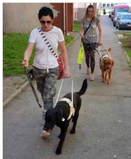
Glory Love ve výcviku (vpředu)