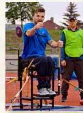
Atletika Bez Bariér Pardubice, z.s.

Atletika Bez Bariér Pardubice je jeden z největších, neúspěšnějších oddílů tělesně postižených atletů v České republice, a to nejen podle počtu členů, ale i podle sportovních výsledků v rámci České republiky i na mezinárodním poli.