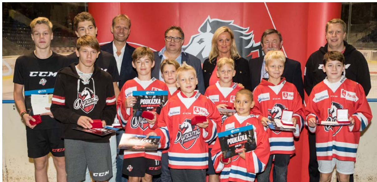
Nadační cena VM – vítězové 2017