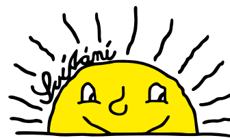
Základní škola a Praktická škola SVÍTÁNÍ, o.p.s.

Podpora školy Svítání je pro Nadaci LR letitou záležitostí dávající smysl a zároveň radost z oboustranné, hezké spolupráce.