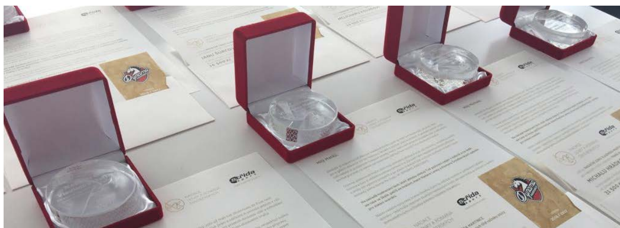
Nadační cena VM