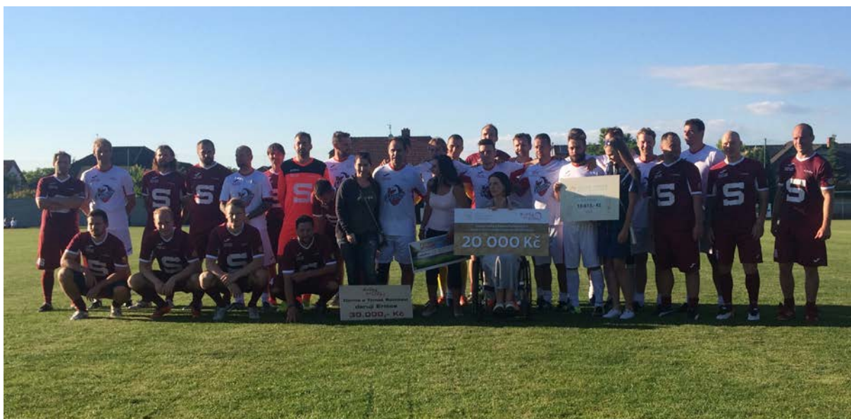
Fotbalové utkání Dynamo – Sparta

Na neurorehabilitační léčbu Eričky poskytla Nadace LR v roce 2017 dva nadační příspěvky ve výši celkem 50.000,- Kč.